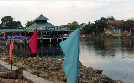
Aménagement des lacs.

Le partenariat se poursuit donc avec l'AIMF pour appuyer la municipalité dans l'établissement de sa stratégie en termes techniques, organisationnels et financiers pour la gestion des boues de vidange de la Ville.