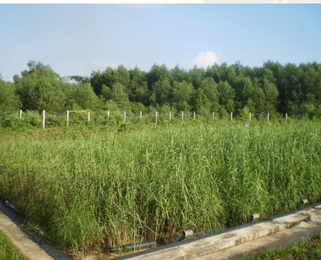
Station de traitement des lixiviats.