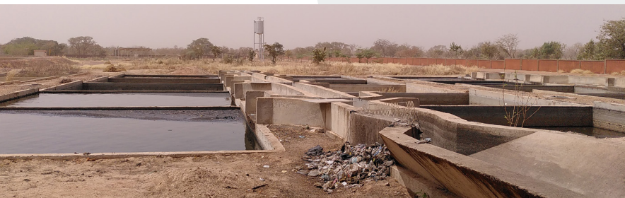
Station de gestion de boues de vidange de Soujourbilla, vue des bassins.

Une collaboration atypique entre le SIAAP et l'Office National de l'Eau et de l'Assainissement (ONEA) pour un partenariat fructueux. Les deux organismes ont conclu plusieurs conventions de coopération technique pour développer les échanges d'expertises entre leurs collaborateurs.