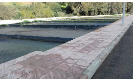
Station de traitement de Frikat.