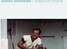
Fou d'eau. Jack Nicholson interrompt une partie de Monopoly dans Vol au-dessus d'un nid de coucou de Milos Forman. (Etats-Unis - 1975).