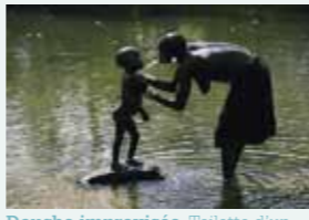
Douche improvisée. Toilette d'un enfant Mursi dans les eaux de la rivière Omo. (Éthiopie)