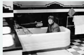
Bain de promo. John Lennon sur le plateau de tournage de A Hard Day's Night. (Londres – 1964)