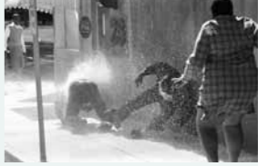
Une douche noire. Le tournage du docu-fiction Mighty Times: The Children's March (Etats-Unis – 2005)