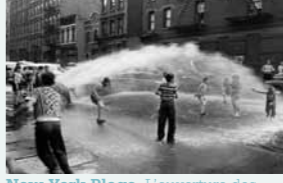
New York Plage. L'ouverture des bornes à incendie, grande tradition estivale des petits new-yorkais. (1953)