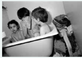
Bain collectif. Reportage pour le Secours populaire français à Villefranche-sur-Saône (« Contes des temps modernes ou la misère ordinaire »). (1988)