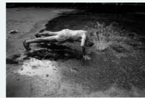
La tête froide. Un jogger à Central Park. (New York – 1980)