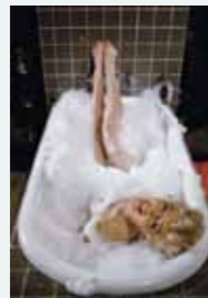
Habit de mousse. Marilyn Monroe sur le tournage de Sept ans de réflexion (réalisation : Billy Wilder) (Gordes – 1949)