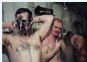
À la mine. Des mineurs de Glamorgan sous la douche à la remontée. (Pays de Galles – 1993)