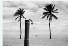
Trois arbres. La plage de Miami Beach. (Floride – 1984)