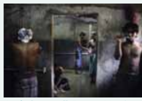
Après le travail. Bains publics à Dacca. (Bangladesh – 2008)