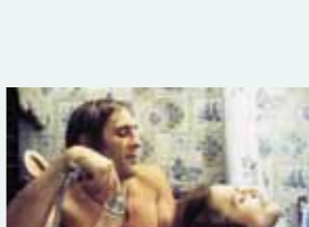
Un bain d'égalité. Gérard Gérard Depardieu et Patrick Dewaere dans Les Valseuses de Bertrand Blier. (France – 1974)