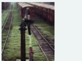
Douche à vapeur. Un homme se douche sous la grue à eau destinée à alimenter les bouilleurs des locomotives à vapeur. (Bangladesh – 1983)