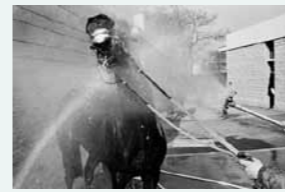
Lavage de crinière. Douche après la course à Auteuil. (Paris – 1985)