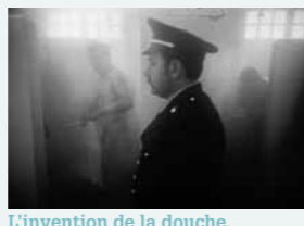
L'invention de la douche. La salle de douche de la prison de Caen. (1976)