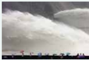
La plus puissante douche du monde. Vidange annuelle du barrage de Xiaolangdi en Chine. (2007)