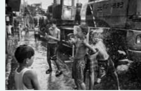
Douche froide. Du bon usage de la mousson comme eau courante. (Manille - Philippines – 1999)