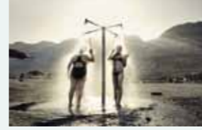
Eau douce. Deux baigneuses rinent le sel déposé sur leur peau après un bain dans la mer Morte. (Israël – 2009)