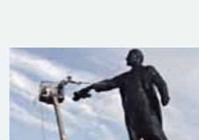
Le patrimoine sous la douche. Un spécialiste nettoie une immense statue de Lénine conservée dans un musée de Saint-Petersbourg. (2010)