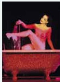
Crazy douche. Dita von Teese dans un spectacle donné au « MGM Grand » de Las Vegas. (2007)