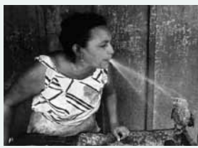
Accord parfait. Par une chaude journée d'été, une femme rafraichit son perroquet. (Nicaragua – 1984)