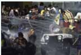
Arrosage automatique. Nouvel An à Mandalay en Birmanie. (1979)