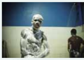
Le plaisir du savon. Jeunes footballeurs de l'académie de football JMG à Bamako. (Mali – 2010)