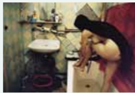
Douche furtive. Douche dans un appartement communautaire de Saint-Petersbourg. (2007)