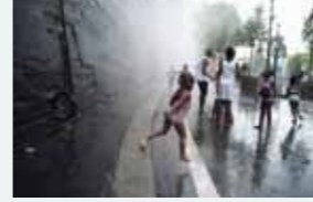
Sur un petit nuage. Les brumisateurs de Paris Plages. (Paris – 2010)