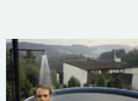
Un sérieux humour. Le compositeur Karlheinz Stockhausen trompe notre œil. (Allemagne – 1970)