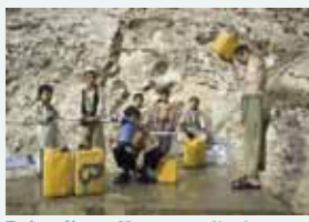
Point d'eau. Un groupe d'enfants remplit des jerricans à un point d'eau équipé par l'ONG tchèque People in Need. (Afghanistan – 2010)