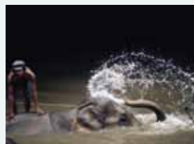
Auto-douche. La toilette de l'éléphant. (Malaisie – 1978)