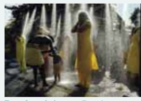
Douche pénitente. Douche purificatrice lors du festival hindou de Thaïpusam. (Malaisie – 2005)