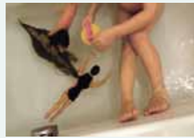
Bain de rires. Love and love project (projet pour le bureau de Magnum Tokyo). (Londres – 2002)