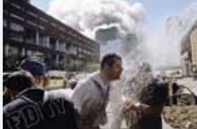
Se réveiller du cauchemar. USA. New York. 11 septembre 2001. Des sauveteurs se rafraichissent sur la West Side Highway. Le World Trade Center est environné par la fumée. La tour s'effondrera à 10:25 ce matin-là. (New York – 2001)