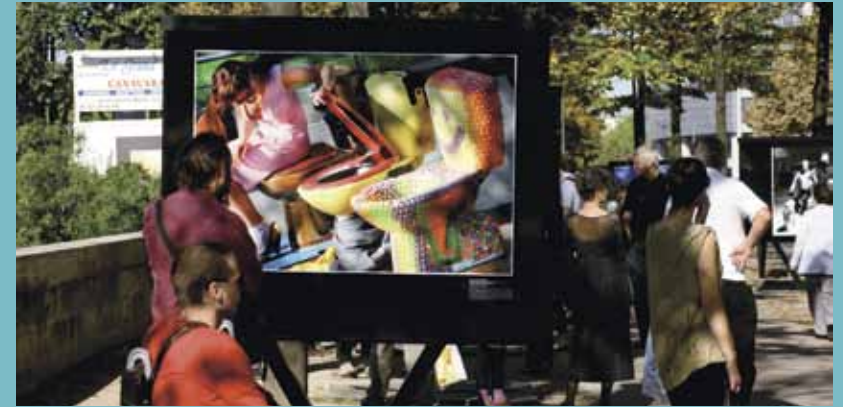
L'exposition Chiotissime! a attiré des dizaines de milliers de visiteurs en septembre 2010 boulevard de la Bastille. Un thème inhabituel, les toilettes, traité sous toutes les coutures.

terrebleue conçoit et organise depuis dix ans des expositions photos en grand format, en extérieur et en accès libre. Son ambition est de proposer à des visiteurs qui n'ont pas l'habitude de se rendre dans les lieux culturels un véritable musée à ciel ouvert. Les expositions terrebleue sont donc destinées au plus grand nombre. En cela, elles ont pu épouser facilement l'esprit de service public du SIAAP.