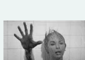
Douche dangereuse. Janet Leigh dans la scène culte de Psychose d'Alfred Hitchcock. (Etats-Unis – 1960)