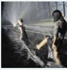
L'enfance de l'art. Installation aquatique de Marc Quinn à l'occasion de la Biennale de Liverpool. (Angleterre – 2002)