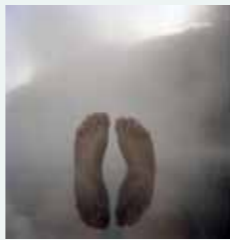
Des pieds dans la brume. Source d'eau chaude naturelle à Kawayu. (Japon – 1998)