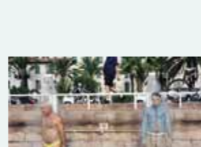
La mode se mouille. La photo de mode vue par Martin Parr. (Nice-2005)