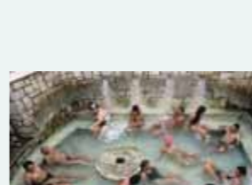
Bain volcanique. Thermes de Saturne en Italie. (Italie – 1995)