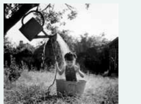
La petite machinerie de Doisneau La douche à Raizeux. (1949)